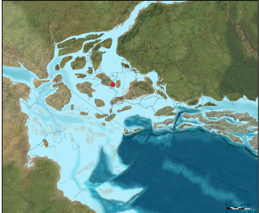
Positioun vu Lëtzebuerg am Unterjura

Opground vun der Plattentektonik louch d'Kontinentalplatt op der sech Lëtzebuerg befënnt, nach méi déif am Süden op der Äerdkugel an ass erreicht an de kommende Joermilliounen op eis méi haiteg nördlech Positioun gerutscht.