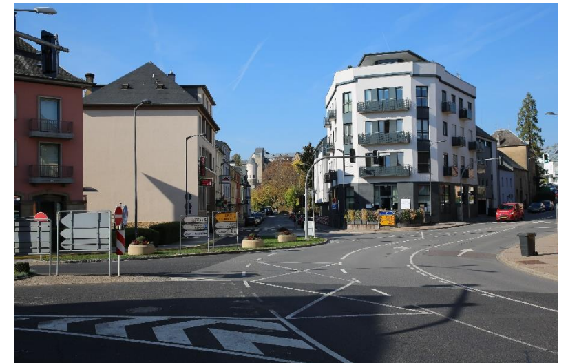
Bildbeschreibung: MERSCHER HAUPTKREUZUNG HEUTE