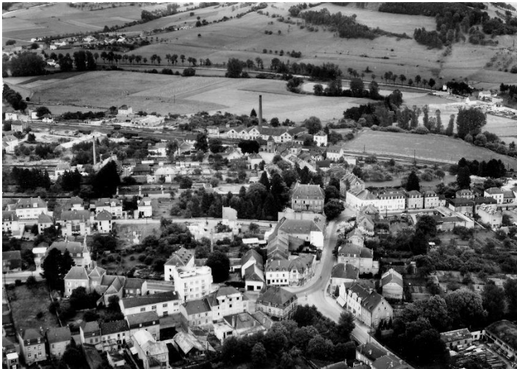
Bildbeschreibung: MERSCH UND DER BAHNHOF 1952