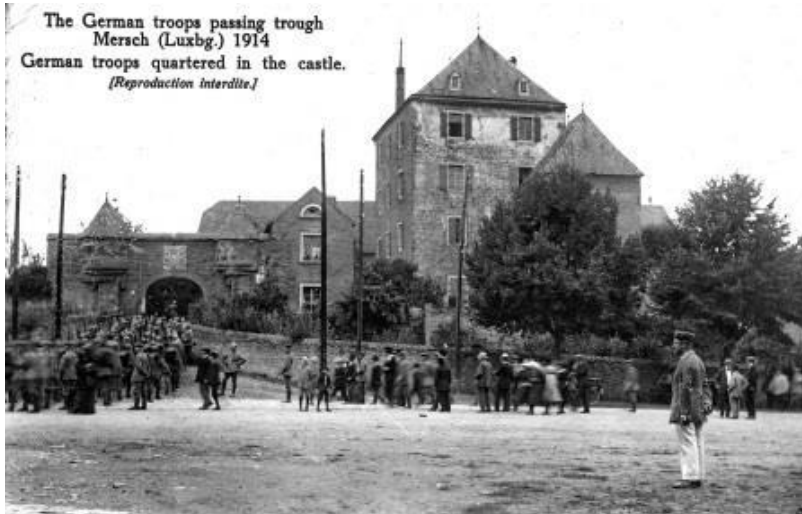
Bildbeschreibung: AUGUST 1914 : DEUTSCHE TRUPPEN LAGERN VOR DEM MERSCHER SCHLOSS ; SIE HATTEN AUCH QUARTIER IM SCHLOSS GENOMMEN