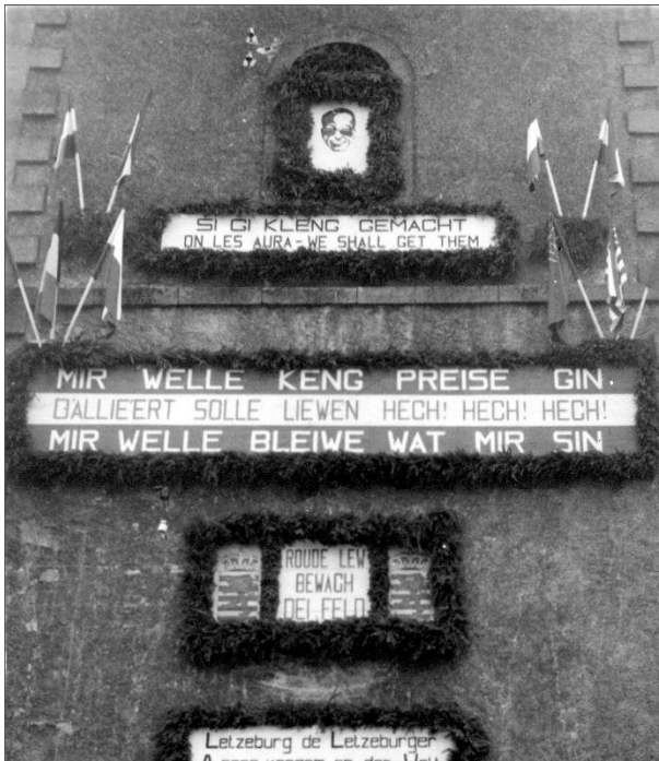
Bildbeschreibung: DER MERSCHER MICHAELSTURM WURDE MIT PATRIOTISCHEN SPRÜCHEN GESCHMÜCKT.