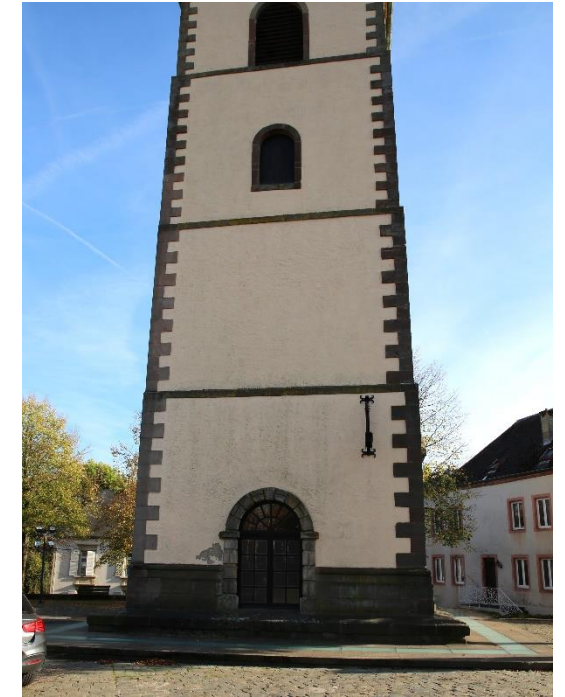
Bildbeschreibung: DER MERSCHER MICHAELSTURM HEUTE