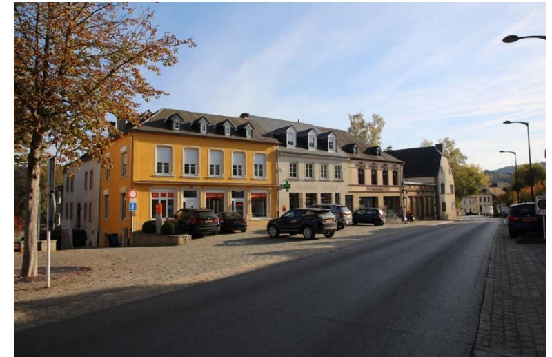
Bildbeschreibung: MARKTPLATZ IN MERSCH 2018