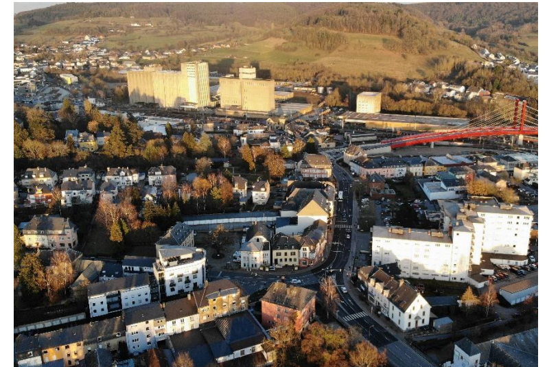
Bildbeschreibung: MERSCH UND DER BAHNHOF HEUTE