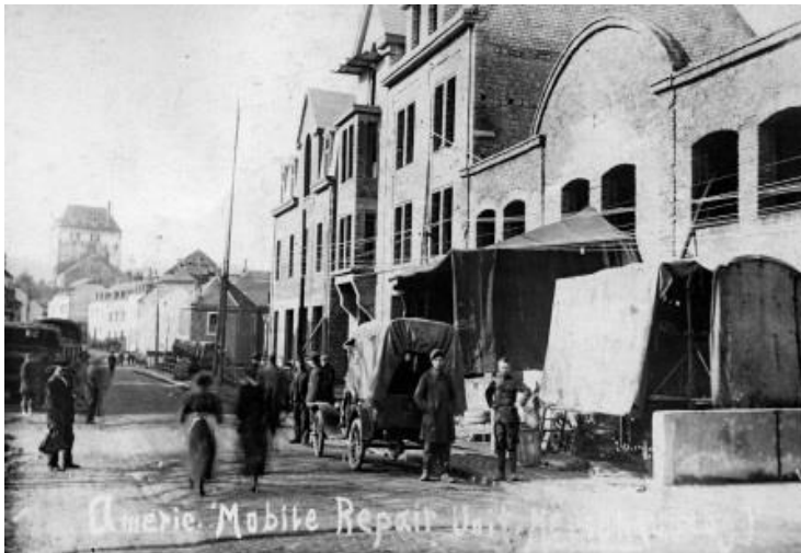
Bildbeschreibung: 1918-1919 AMERIKANISCHE TRUPPEN IN DER HEUTIGEN RUE GRANDE-DUCHESSE CHARLOTTE. IM HINTERGRUND DAS MERSCHER SCHLOSS

THEMA Detailbilder vergleichen (Mobilität) / Standortvergleich (Gebäude und Mobilität)