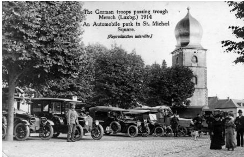
Bildbeschreibung: DEUTSCHE AUTOMOBILE AUF DEM MARKTPLATZ IM AUGUST 1914