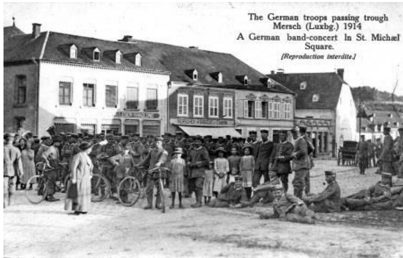
Bildbeschreibung: DEUTSCHE TRUPPEN AUF DEM MARKTPLATZ IN MERSCH IM AUGUST 1914.