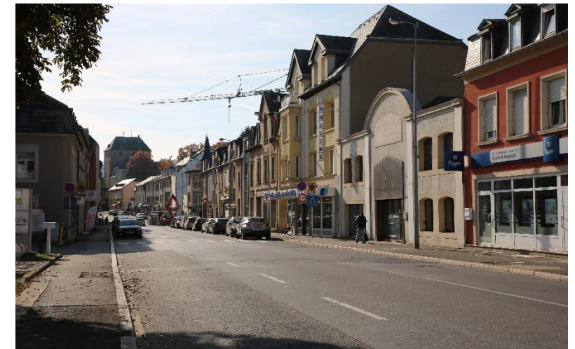
Bildbeschreibung: RUE GRANDE-DUCHESSE CHARLOTTE HEUTE (Bild: H. Krier)