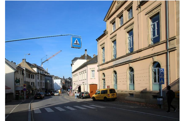
Bildbeschreibung: SITUATION HEUTE