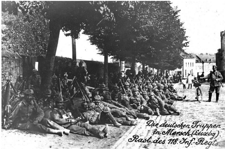
Bildbeschreibung: 1. Weltkrieg. DEUTSCHE TRUPPEN IN MERSCH RASTEN IM SCHATTEN DER BÄUME.