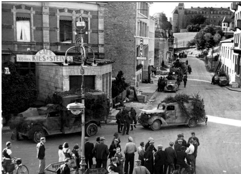
Bildbeschreibung: MERSCHER HAUPTKREUZUNG 9. SEPTEMBER 1944. GAFFENDE MERSCHER EINWOHNER BEOBACHTEN DAS RÜCKZUGSMANÖVER DER DEUTSCHEN WEHRMACHT DURCH DIE ARLONER STRASSE.