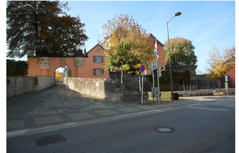
Bildbeschreibung: GEMEINDEHAUS IN MERSCH HEUTE