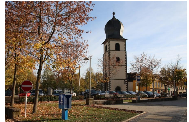
Bildbeschreibung: MARKTPLATZ IN MERSCH 2018